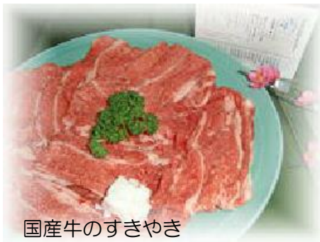
国産牛のすきやき